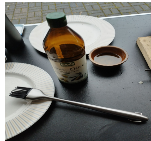
nou nau Urlech un Pensel...