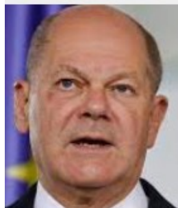
nau ne Ploume