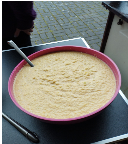
dann chit dat Daach