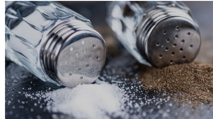
Ssalt un Pierper